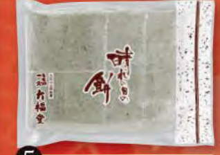
⑤ のし餅(草) (小・450g) 塩味付・切れ目入り、8枚切れ 756円 (税込) (本体価格700円) 賞味期限: 製造日より未開封で2週間