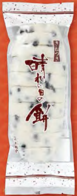
⑥ なまこ型豆餅 (740g) 塩味付・切れ目入り 1,188円 (税込) (本体価格1,100円) 賞味期限: 製造日より未開封で1週間