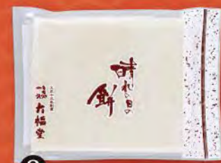
② のし餅(白) (各小・450g) 切れ目入り、8枚切れ 702円 (税込) (本体価格650円) 賞味期限: 製造日より未開封で2週間