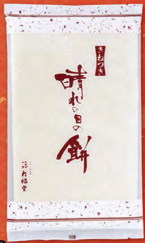
① のし餅 (大・900g) 切れ目入り、16枚切れ 1,296円 (税込) (本体価格1,200円) 賞味期限: 製造日より未開封で2週間

ご予約特典 ご予約の上、税込3,000円以上お買上げのお客様に、粗品「ゆめぴりか」3合(450g)を進呈いたします。