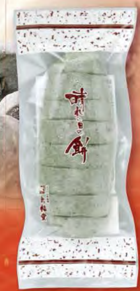
⑦ なまこ型草餅 (350g) 塩味付・切れ目入り 594円 (税込) (本体価格550円) 賞味期限: 製造日より未開封で2週間