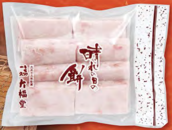
⑨ えび入りのし餅 (425g) 塩味付、8枚切れ 864円 (税込) (本体価格800円) 賞味期限: 製造日より未開封で1週間