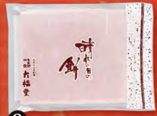
③ のし餅(赤) (各小・450g) 切れ目入り、8枚切れ 702円 (税込) (本体価格650円) 賞味期限: 製造日より未開封で2週間