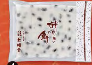
④ のし餅(黒豆) (小・450g) 塩味付・切れ目入り、8枚切れ 756円 (税込) (本体価格700円) 賞味期限: 製造日より未開封で1週間